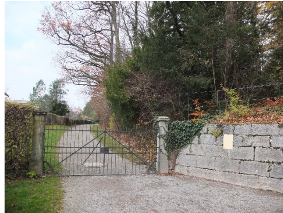
Oben: Sonnenbergpark, Türmlihuus, Alte Kaserne Kulturzentrum, Lörlibad